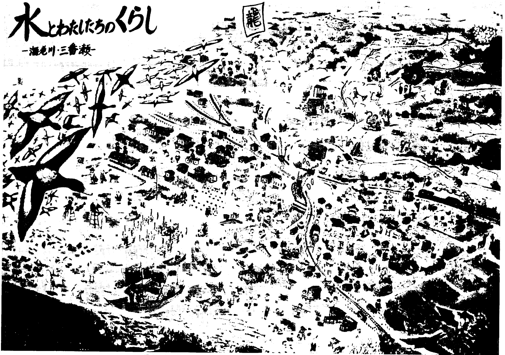
図2 水とわたしたちの暮らし —海老川・三番瀬— (昔)