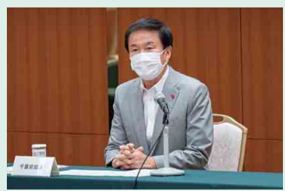
森田知事あいさつ

また、総合企画部長を本部長とする「令和2年国勢調査千葉県実施本部」を4月1日に設置し、全庁的な連携体制の下、正確かつ円滑な調査の実施に向け業務を推進しています。