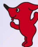
千葉県PR マスコットキャラクター 「チーバくん」