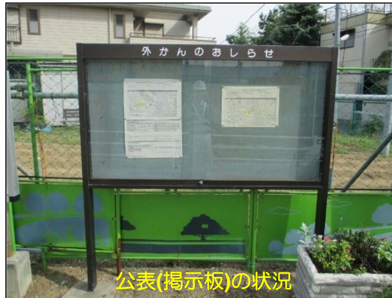
公表(掲示板)の状況