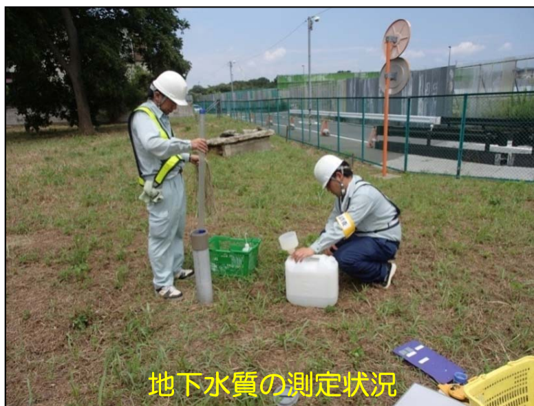
地下水質の測定状況