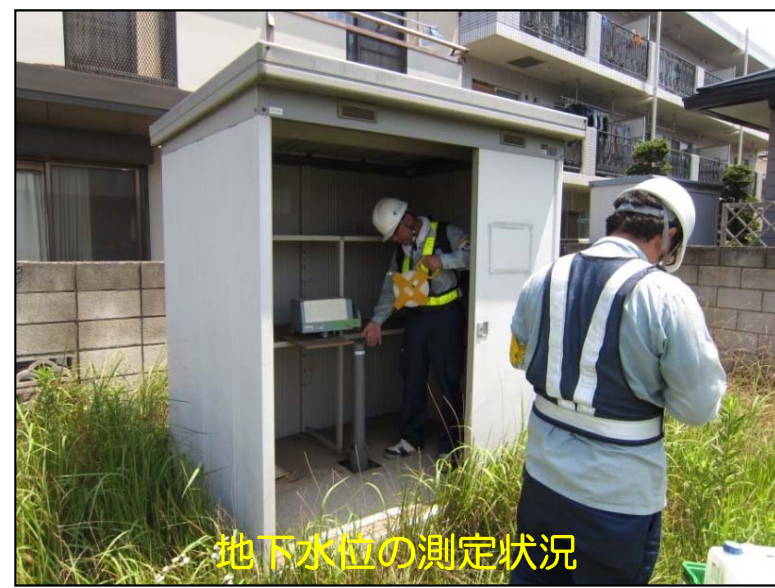
地下水位の測定状況