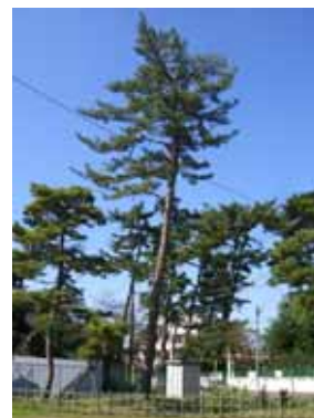
現在の移植木状況

試験施工を行った3本のクロマツを対象に、樹木の専門家（樹木医）による健全度診断を夏季及び秋季に実施。その結果移植後2年半を経過したH20年秋の現時点でも「移植前の診断結果と同様で変化はなく、試験木については生育に問題ない。」との所見を得ているところである。