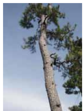
生息するクロマツの状況