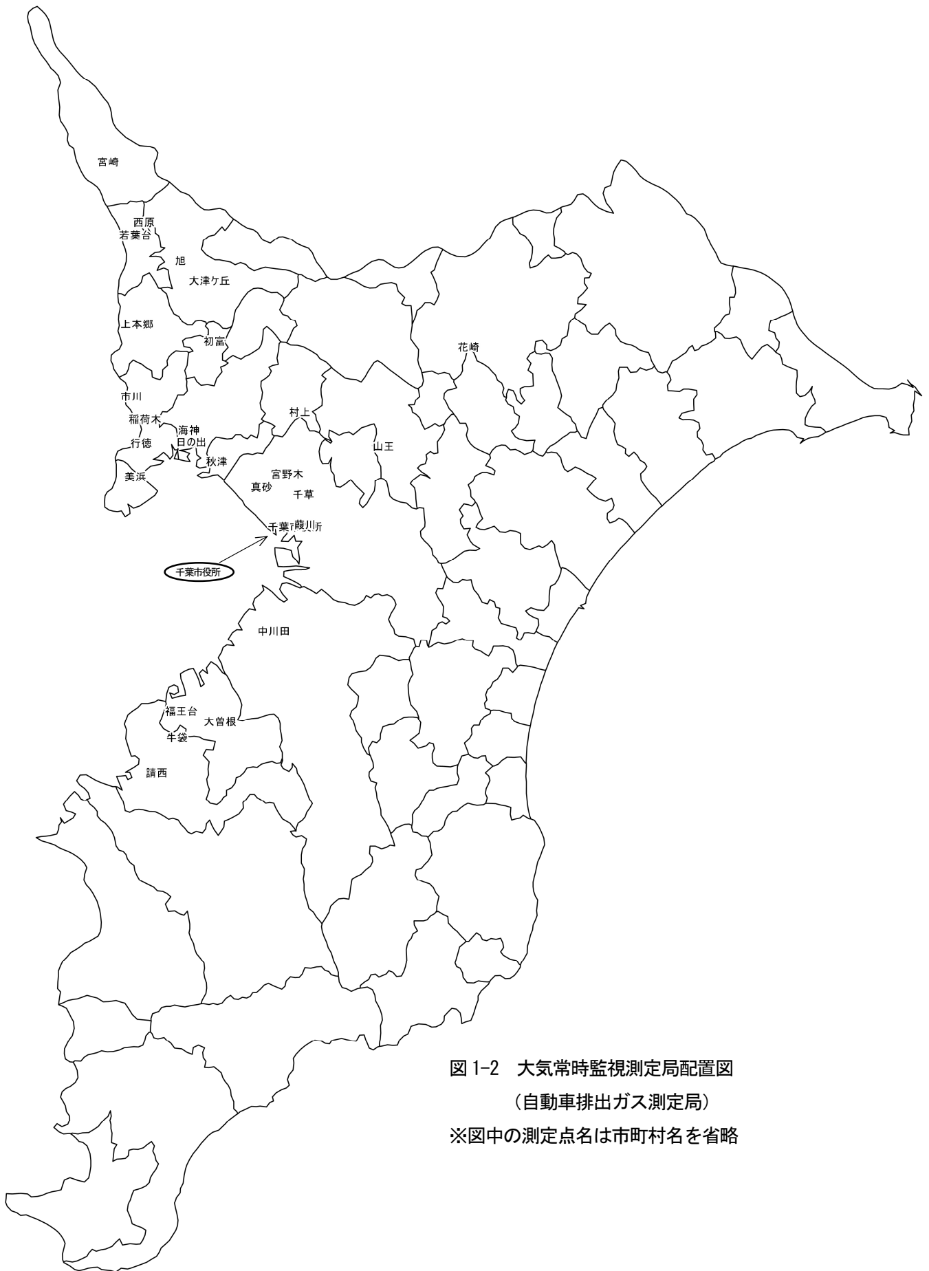
図 1-2 大気常時監視測定局配置図 (自動車排出ガス測定局) ※図中の測定点名は市町村名を省略