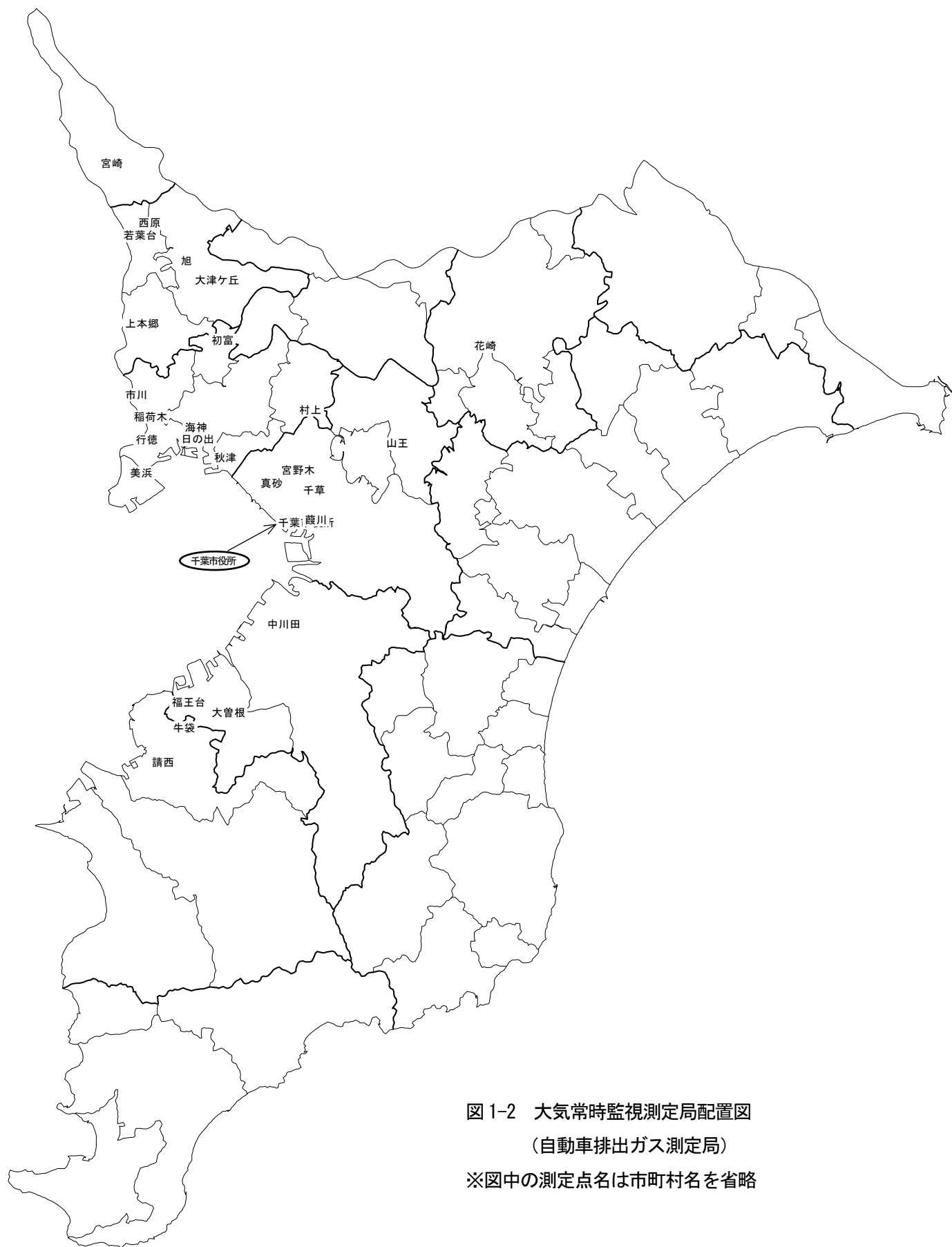
図 1-2 大気常時監視測定局配置図 (自動車排出ガス測定局) ※図中の測定点名は市町村名を省略