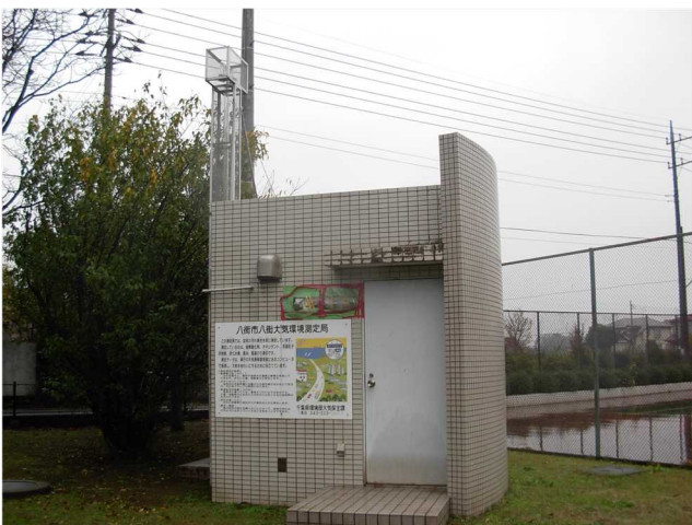
大気環境常時監視測定局(八街市八街局)