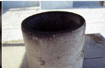
煙突の内側に使用 石綿含有断熱材