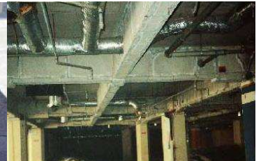
鉄骨を被覆して保護 石綿含有耐火被覆材