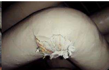
エルボ部に使用 石綿含有保温材