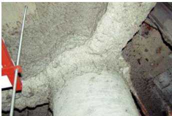
柱や梁に施工 吹付け石綿