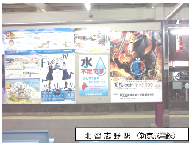
北習志野駅 (新京成電鉄)