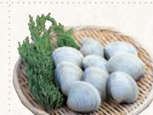
35 三番瀬ホンピノス貝