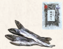
10 九十九里焼き田作り