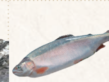
30 木更津おかさだちサーモン