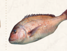
25 鋸南町勝山漁協 養殖江戸前真鯛