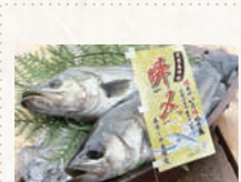
34 江戸前船橋瞬みずずき