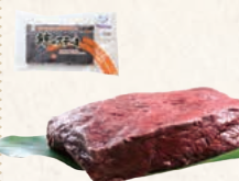
22 房州和田浦つち鯨