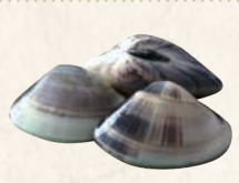
6 九十九里地はまぐり