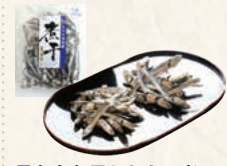
9 九十九里かねとの煮干 (青口、白口)