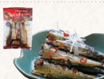
33 千葉銚子水揚げ ビリ辛いわし