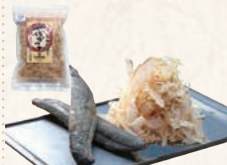
20 房州産鰹節・花かつお