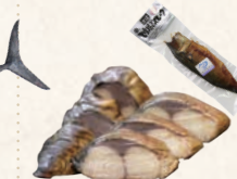
18 さばてり焼きスモーク