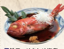
3 銚子つりきんめ姿煮 浜のかあちゃん仕立て