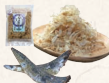
21 房州産鰹節・鯖花割り