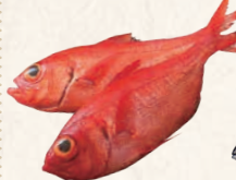
16 外房つりきんめ鯛