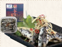
7 九十九里いわしのごま漬