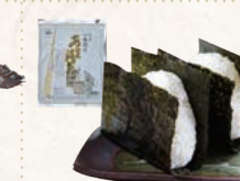
31 金田産一番摘みあま海苔 (焼海苔)