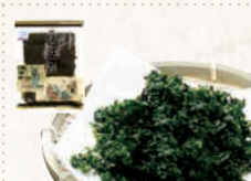
32 金田産焼ばら乾海苔