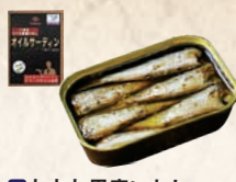
2 九十九里産いわし オイルサーディン