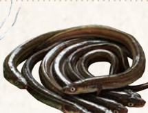
27 大佐和漁協江戸前あなご