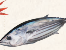
17 勝浦産ひき縄カツオ