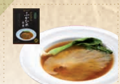
4 プレミアムふかひれ姿煮