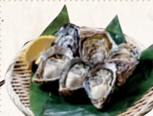
28 新富津漁協 江戸前オイスター