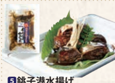
5 銚子港水揚げ 骨まで食べられる イワシのやわらか煮