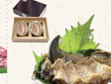
23 天然あわび海女の味噌焼き