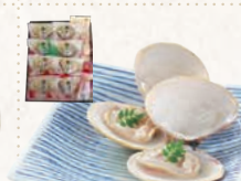
36 九十九里浜蛤酒蒸し