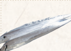
26 竹岡つりタチウオ