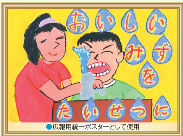
●広報用統一ポスターとして使用