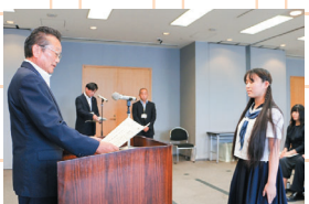
令和元年度 千葉県表彰式の様子