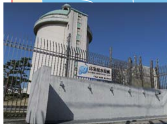
◀ 応急給水拠点 栗山浄水場 ⑬