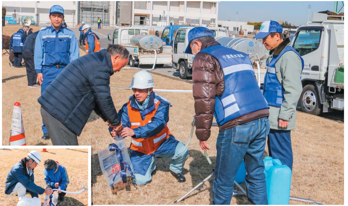
広域断水の発生を想定した応急給水訓練の様子

今年の1月末に、「日本水道協会関東地方支部(南関東ブロック)合同防災訓練」を、千葉県水道局の柏井浄水場で行ったんだ。