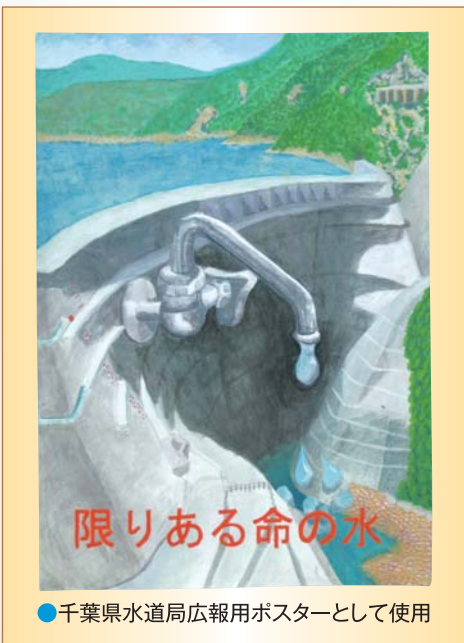
●千葉県水道局広報用ポスターとして使用