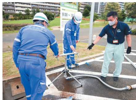
応急給水用仮設給水栓を用いた習志野市との訓練

市と協力し、指定避難場所(学校・公民館・公園など)などで給水車や消火栓等からの応急給水用仮設給水栓などを用いた応急給水を行う場合があります。これらの給水場所についても、市や千葉県営水道のホームページなどでお知らせします。日ごろからお近くの指定避難場所を確認しておきましょう。 ※指定避難場所はお住まいの市役所ホームページなどでご確認ください。