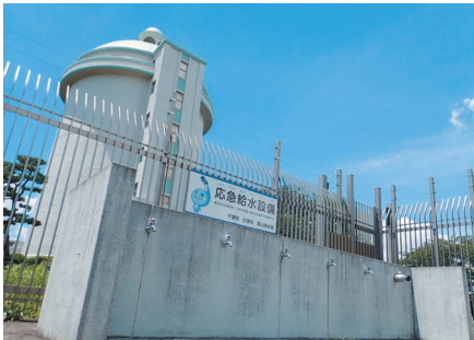
応急給水拠点(栗山浄水場)

大きな災害が発生したときは、最寄りの「応急給水拠点」で水をお配りしています。(市をまたいでの利用も可能です)ただし、開設には時間を要する場合がありますので、ホームページなどで確認をお願いします。