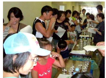
▲親子で利き水を体験