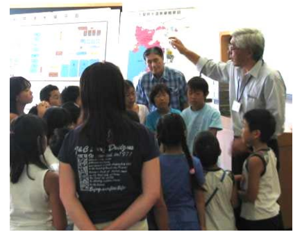
▲浄水場見学会でのふれあい

新浄水場（ちば野菊の里浄水場）通水記念イベントでは、浄水施設見学と出来たての水道水を試飲いただきます。