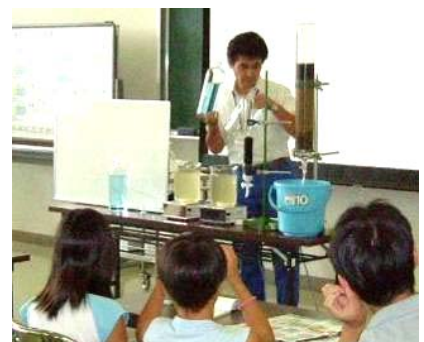
▲水道水ができるまでの実演