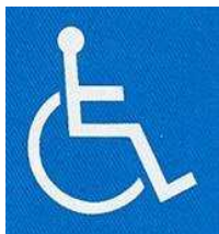
【障害者のための国際シンボルマーク】