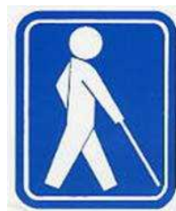
【盲人のための国際シンボルマーク】

障害のある人が利用できる建物、施設であることを表す世界共通のマーク。障害の種類や程度にかかわらず、全ての障害のある人を対象としている。