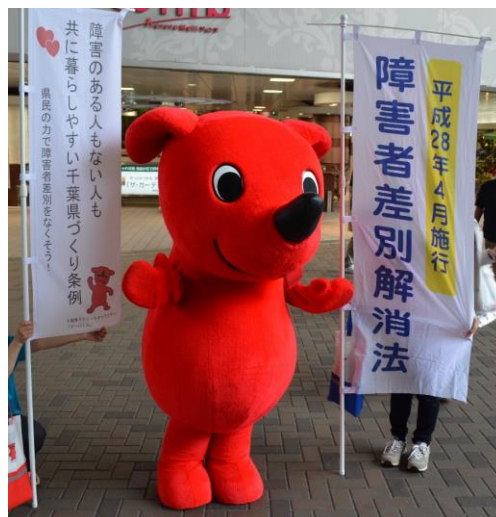
障害者条例・障害者差別解消法のPR活動