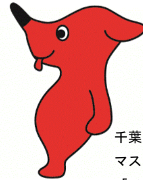
千葉県 マスコットキャラクター 「チーバくん」