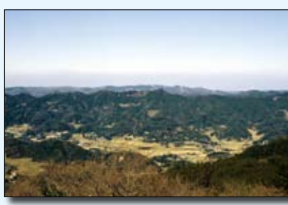
7 嶺岡山系からの展望

県立九十九里自然公園 旭市刑部岬から南のいすみ市太東岬までの弓状に湾曲した約 60km の海岸を主体とし、砂浜と防風林による雄大な景観を形成しています。 【関係市町村】 一宮町・長生村・白子町・大網白里町・千葉市・九十九里町・山武市・横芝光町・東金市・旭市・匝瑳市・銚子市