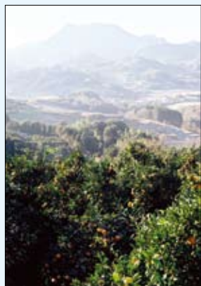
4 伊予ヶ岳