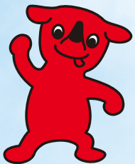
千葉県マスコットキャラクター「チーバくん」