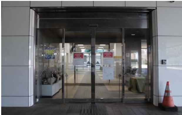
①(会場入口)消毒・検温