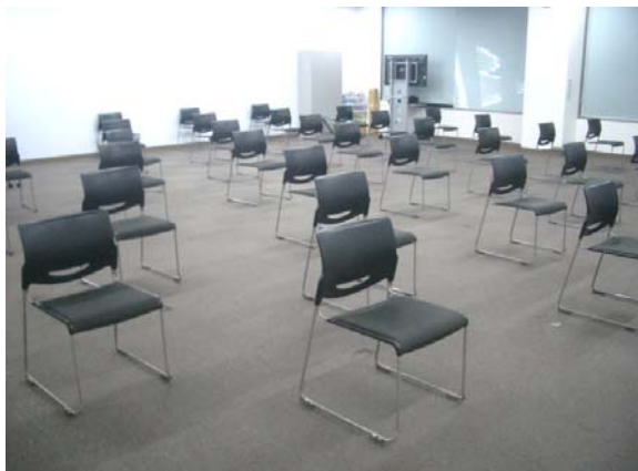
③ 予診票記載兼待機所