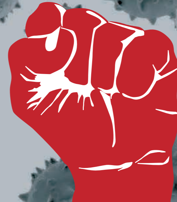
(画像はイメージです)