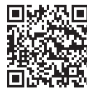
千葉県の梅毒・HIV等の休日検査に関するページ