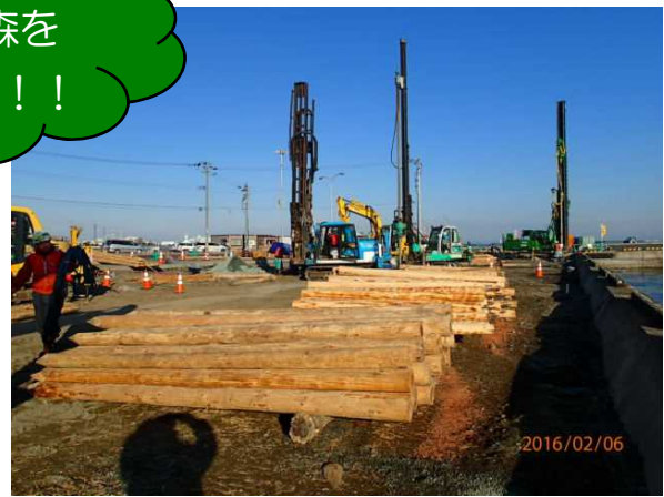
LP-LiC 工法による漁港の耐震強化岸壁の液状化対策 (青森県八戸市)