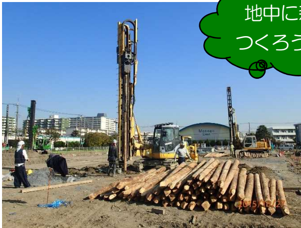
LP-LiC 工法による分譲住宅地の液状化対策 丸太 14,420 本を使用 (千葉県千葉市)