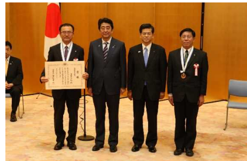
「第6回ものづくり日本大賞」 内閣総理大臣賞(2015年度)を受賞している 信頼おける工法です。