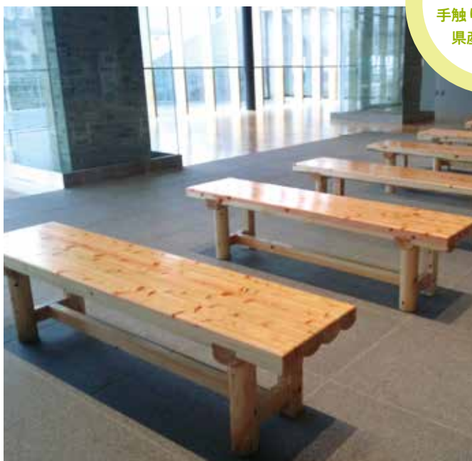
ヒノキ半割ベンチ 本体：W1800×D400×H400mm 種類：ウレタン仕上げ