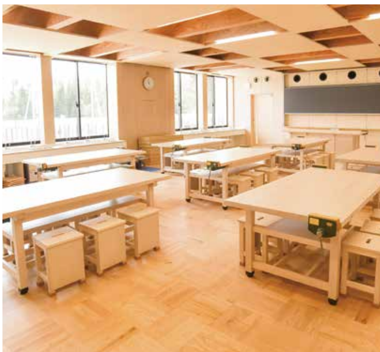
おおぐろの森小学校の図工室（流山市）