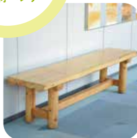
千葉県庁の19階にも設置されています。