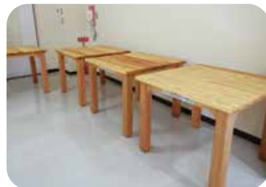
スギテーブル 本体：W900×D900×H700mm 種類：ウレタン仕上げ

森林環境譲与税を活用し、県産材を使ったベンチの製作を行っています。相談を受けた後に、設置場所に合った木製品を提案します。原木の調達から製材・乾燥、完成品の設置まで一貫して対応し、設置後のメンテナンス方法も案内しています。特に、木材が地面に接する案件では維持管理費の計上や耐久性向上のための助言を行います。千葉県の森林に関わる幅広い取り組みを担い、木に関する多様な製品を製作しています。また、小学校への木育出張講習や植樹の支援にも取り組んでいます。