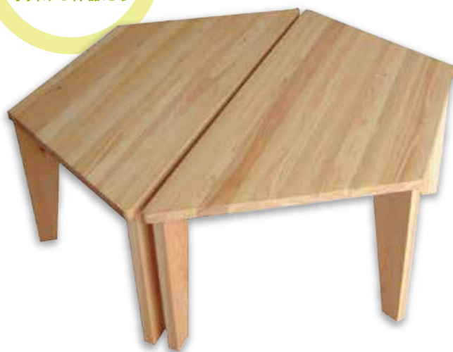
おともだちテーブル(台形・丸・その他) 本体：W600×D600×H～500mm 価格：49,500円(税込)～ 種類：ヒノキ製