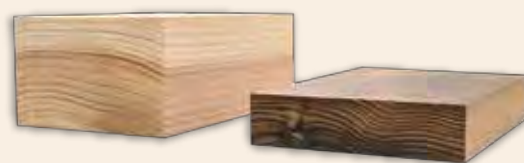
圧力をかけて潰した圧縮材はより堅固になります。