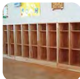
木製ロッカー(2人・4人・5人用) 本体：W260×D400×H930mm 種類：スギ集成材 内寸(1箇所)ウレタン仕上げ 裏板合板千葉県産スギ 山梨県産カラマツハイブリット