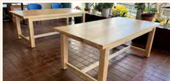
テーブル 本体：W1800×D900×H700mm 種類：ヒノキウレタン仕上げ

森林環境譲与税を活用し、県産材を使ったベンチの製作を行っています。相談を受けた後に、設置場所に合った木製品を提案します。原木の調達から製材・乾燥、完成品の設置まで一貫して対応し、設置後のメンテナンス方法も案内しています。特に、木材が地面に接する案件では維持管理費の計上や耐久性向上のための助言を行います。千葉県の森林に関わる幅広い取り組みを担い、木に関する多様な製品を製作しています。また、小学校への木育出張講習や植樹の支援にも取り組んでいます。