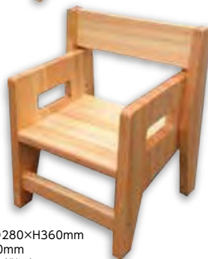
なかよしチェア 本体：W340×D280×H360mm 座面高180mm 価格：16,500円(税込)～ 種類：ヒノキ製

台形のテーブルは、横に並べたり円を描くように囲んだり、使い勝手は自由自在です。節の少ない白太や赤身との混在など、ヒノキの特性を活かした園児用家具は、ビスを多用せず木ダボで接着し、面取り加工で安全性を高めています。自社で手間をかけて乾燥させた木材は高品質で、芳醇な香りも魅力です。