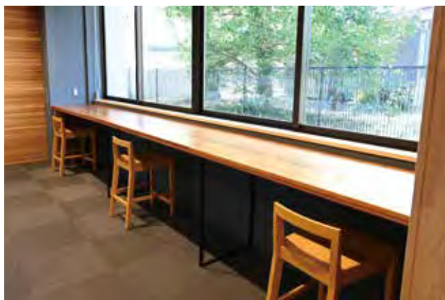
岬公民館の図書室（いすみ市）

図書室で利用頻度の高い本棚や椅子、ベンチは、スギの圧縮材で製作しています。傷がつきにくく、スギならではのやわらかな木触りが魅力です。圧縮率の違いによってタンニンの発現が変化し、硬度が増すほど色合いも濃くなります。台風被害で発生した倒木を有効活用したことを契機に圧縮材への取り組みが始まり、現在ではカフェテーブルや学習機の製作にも展開されています。使いやすさを考慮したスマートなデザインは、一枚板テーブルやセレクト家具を数多く手掛けてきた「大丸NOiZ.」ならではの品質です。