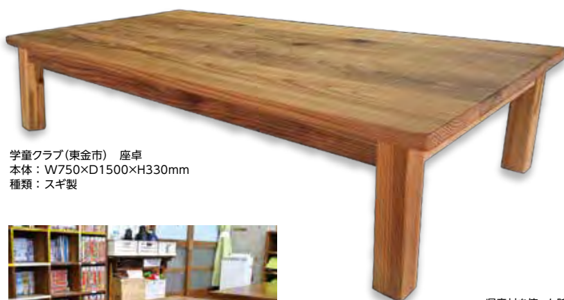
学童クラブ(東金市) 座卓 本体：W750×D1500×H330mm 種類：スギ製