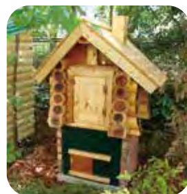
ログスモーカー 価格：200,000円(税込) (七輪等付属品、基礎工事代別途)