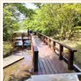
加曽利じゅん菜池公園(千葉市)