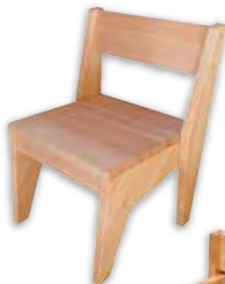
おともだちチェア 本体：(L)W340×D320×H500mm 座面高280mm (M)W320×D300×H450mm 座面高250mm (S)W300×D280×H400mm 座面高220mm 価格：16,500円(税込)～ 種類：ヒノキ製