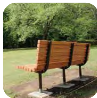
泉自然公園のベンチ(千葉市) 本体：W1800×D592×H782mm

千葉県内の公園などにおける木製施設の新設やリニューアルにあたり、千葉県産の木材を使用したベンチや野外卓などの製造を行っています。県産材には、防腐・防蟻のための適切な加圧注入木材保存処理を自社工場で行い、屋外での耐久性を確保し木材の特長を活かした製品作りを行っています。また、規格品に加えてオーダーメイドにも対応し、ベンチ以外にも遊具やデッキ、木橋、サイン、東屋など、公園や景観施設全般の設計、販売、加工、保存処理、組立据付まで一貫した対応が可能です。