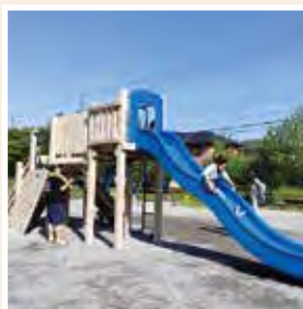
みどりが丘中央公園(大網白里市)

千葉県内の公園などにおける木製施設の新設やリニューアルにあたり、千葉県産の木材を使用したベンチや野外卓などの製造を行っています。県産材には、防腐・防蟻のための適切な加圧注入木材保存処理を自社工場で行い、屋外での耐久性を確保し木材の特長を活かした製品作りを行っています。また、規格品に加えてオーダーメイドにも対応し、ベンチ以外にも遊具やデッキ、木橋、サイン、東屋など、公園や景観施設全般の設計、販売、加工、保存処理、組立据付まで一貫した対応が可能です。