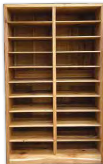
本納小学校(茂原市) レターケース 本体：W770×D350×H1250mm 種類：スギ製

安全面を考慮し角を面取りした学童用の机や、先生と子どもたちが一緒に使いやすいレターケース。これらの什器は、千葉県産材を活かし、日々の暮らしの中で木に触れて親しむことを大切にしたい地産地消の企画から生まれました。時間とともに色合いが変わり、使う人の成長や思い出と重なり合う木の表情は、自然と木育につながっていきます。