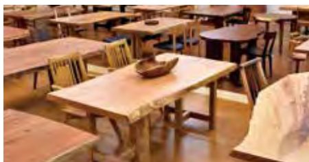
大丸NOiZ.一枚板展示場

図書室で利用頻度の高い本棚や椅子、ベンチは、スギの圧縮材で製作しています。傷がつきにくく、スギならではのやわらかな木触りが魅力です。圧縮率の違いによってタンニンの発現が変化し、硬度が増すほど色合いも濃くなります。台風被害で発生した倒木を有効活用したことを契機に圧縮材への取り組みが始まり、現在ではカフェテーブルや学習機の製作にも展開されています。使いやすさを考慮したスマートなデザインは、一枚板テーブルやセレクト家具を数多く手掛けてきた「大丸NOiZ.」ならではの品質です。