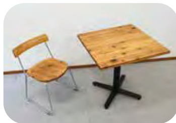
県産材テーブル 本体：W700×D700×H710mm ウレタン塗装 スギ製（圧縮材）