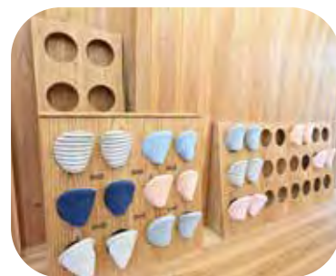
スリッパ立て 本体：(大) W1170×D40~160×H600mm (小) W640×D90~160×H650mm 穴のサイズ：φ110mm

生産地ならではのサンプスギをふんだんに使用した大きなリビングテーブルは、木目の美しさや色合いを堪能できる逸品。丸い穴に収納するスリッパ立ても、シンプルなデザインが素材の良さを引き立てます。加工後に生まれるツヤや程よい硬さなど、木材の個性を活かした仕上がりです。石井工業株式会社では、長年にわたりこの「地元の宝」を大切に扱い、サンプスギを用いた注文住宅も手掛けています。時を重ねるごとに深まる飴色の風合いが魅力で、壁材・床材はもちろん、造り付け家具の製作にも対応しています。