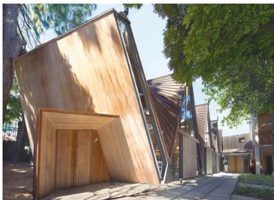
東京大学弥生講堂 アネックス