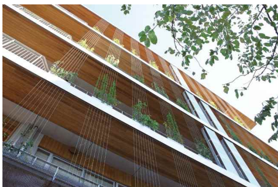
東京都中央区立中央小学校