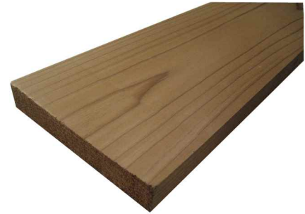
40℃・90%RHで調湿後、全乾状態まで乾燥させたときの収縮率

千葉県産材をはじめとした地域産材の指定が可能です。国産材活用が促進される今、建築物の木質化や外構に適した材料です。