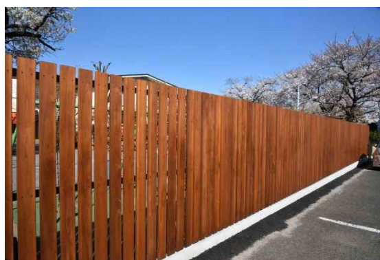
めぐみ幼稚園（東京都立川市）