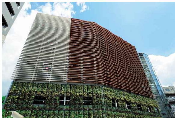
港区立麻布図書館