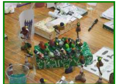
子どもたちの作品