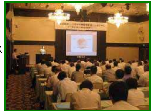
シンポジウム会場の様子