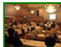
船橋市食品衛生協会 特別委員会夏期講習会 (7/4)