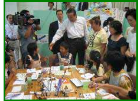
会場を訪れた太田農林水産大臣と子どもたち