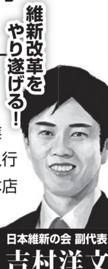
日本維新の会 副代表 吉村洋文