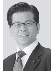
公明党代表 石井啓一

小さな声を聴く力、粘り強い政策実現力、国と地方をつなぐ力—— こうした公明党の堅実な力で、未来につながる改革を進めます。