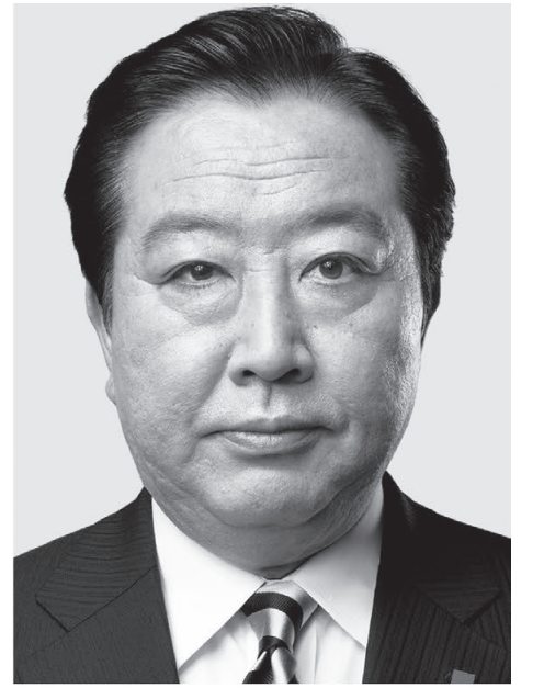
立憲民主党 代表 野田佳彦

1 政治改革 政治の信頼回復 ●政治資金を徹底的に透明化し、裏金・脱税を許しません。 ●金権政治の温床となる企業・団体献金を禁止 ●国会議員の政治資金の世襲を制限 ●税金の使い方を徹底的に透明化、効率化