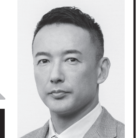
れいわ新選組 代表 山本太郎