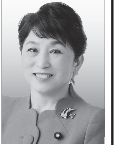
社民党党首 福島みずほ