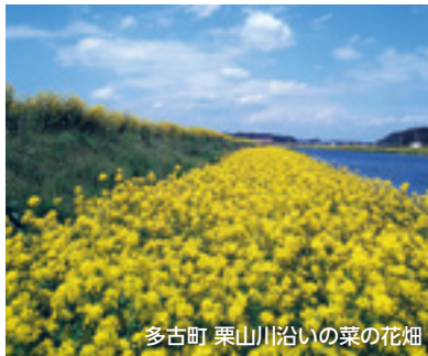
多古町 栗山川沿いの菜の花畑