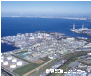
京葉臨海コンビナート