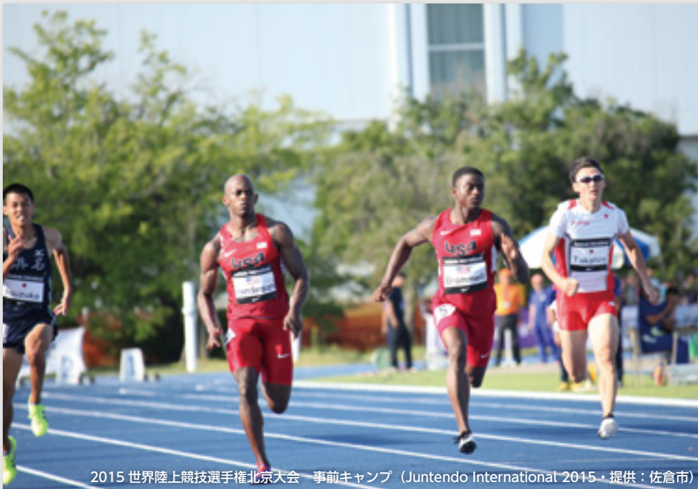
2015 世界陸上競技選手権北京大会 事前キャンプ (Juntendo International 2015)

～東京オリンピック・パラリンピックを契機とした 「世界中から人々がやってくるCHIBA」づくり～