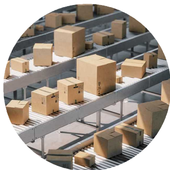
県内製造品出荷額等