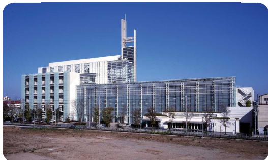
中小企業等の研究開発などを総合的に支援する東葛テクノプラザ