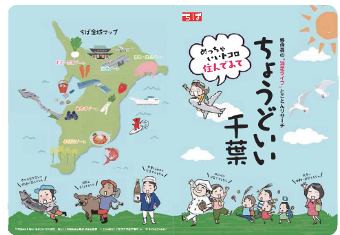
千葉の暮らしやすさを紹介する「ちよつどいい千葉」