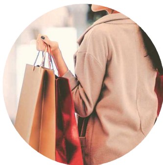
県内年間商品販売額