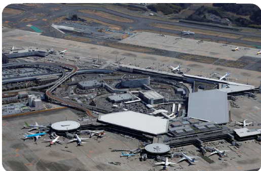
成田国際空港