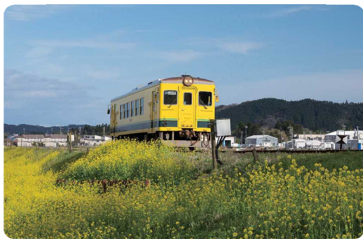
菜の花といすみ鉄道