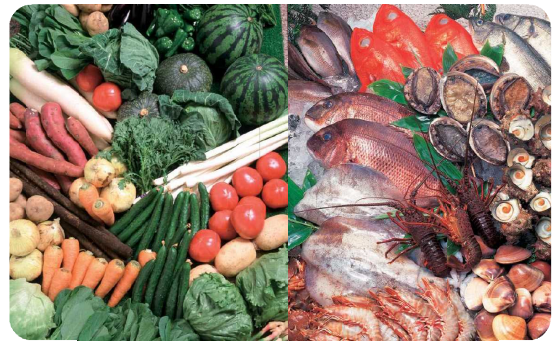
ちばの農林水産物