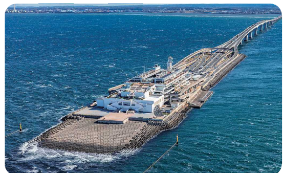
東京湾アクアライン