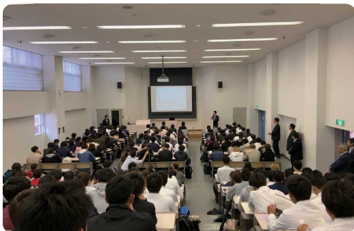
若者と一緒に考える地域活性化セミナー