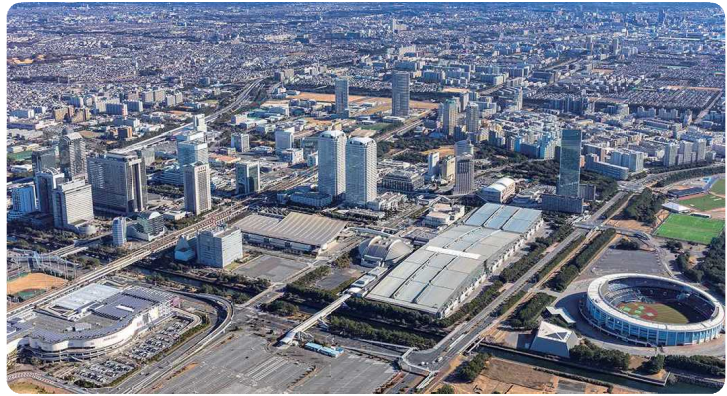
幕張メッセ周辺地域