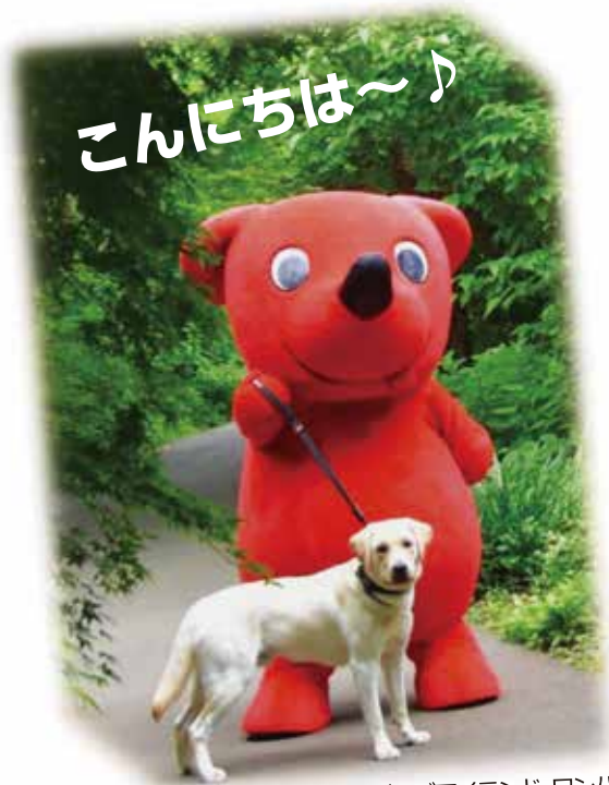
チーバくん & さとちゃん (ドギーズアイランド ワンバサダー)