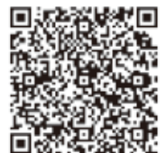
千葉県ホームページ

皆さんが参加できる「プラス防犯」の取組や防犯パトロールに関する情報を掲載しています。