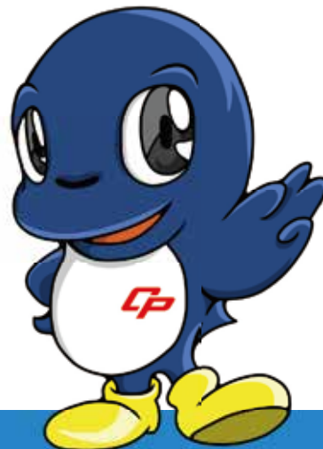
だれからもしんらいされ だれにもしたしまれる ちばけんけいさつ シンボルマスコット シーポック