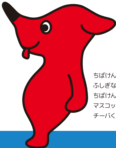
ちばけんにすむ ふしぎないきもの ちばけん マスコットキャラクター チーバくん

じぶんのみをまもるための あいことば「 いかのおすし 」を このぬりえにすきないろをぬりながら、 チーバくん・シーポックと いっしょにべんきょうしましょう さいごのページでは このぬりえでべんきょうしたことが おぼえられたか おうちのひとにみてもらって たくさん○をもらってね!