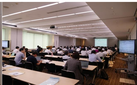
事例報告会の様子