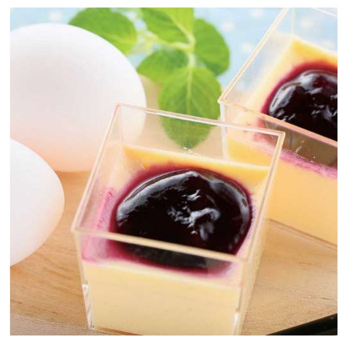
株式会社菜の花エッグ 菜の花たまごのホワイトチョコプリン