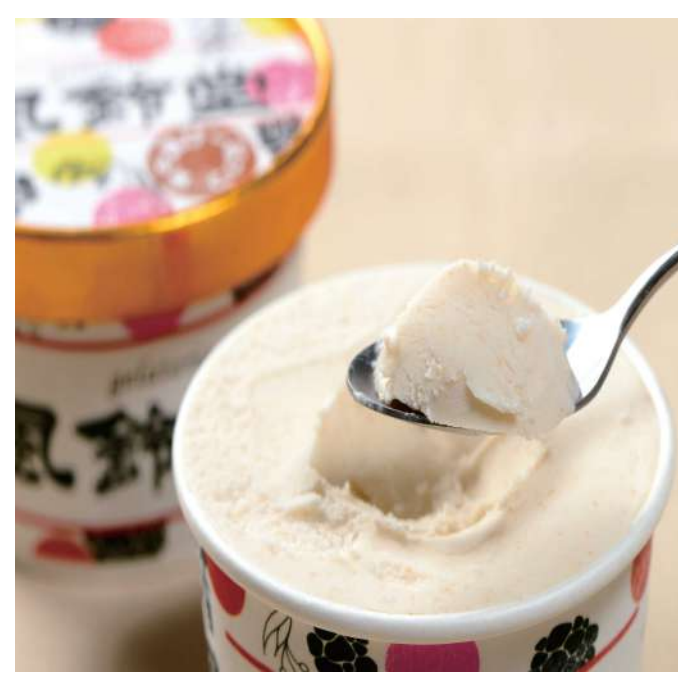
風鈴堂合同会社 千葉ピーナッツゼラート