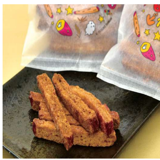
合同会社 BUONACASA ビスケット