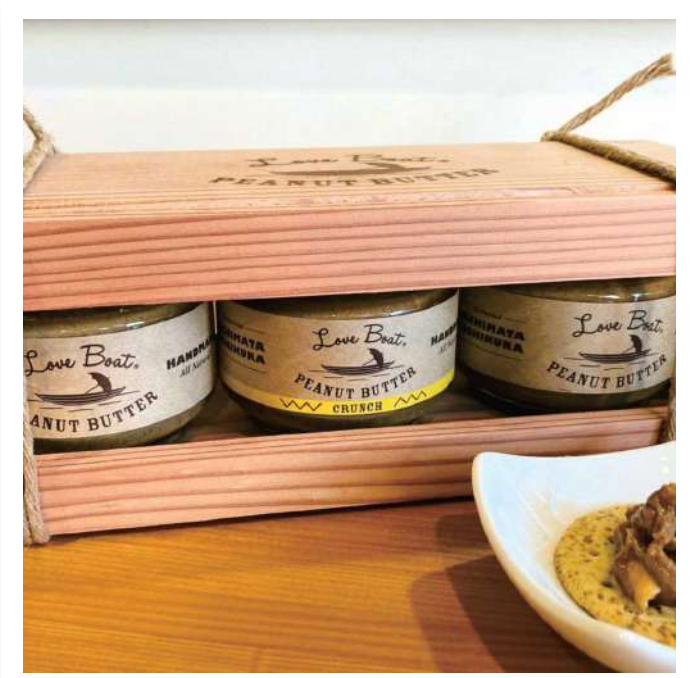
株式会社 YACHIMATA YOSHIKURA LoveBoat ピーナッツバター