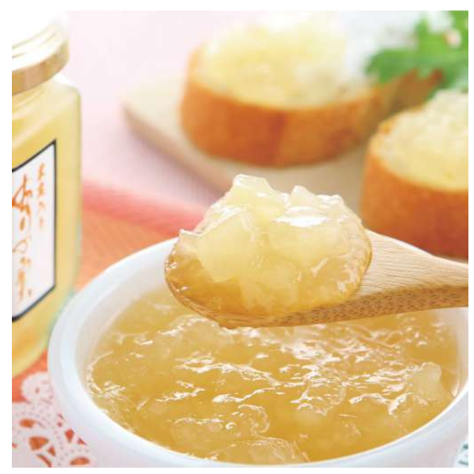
有限会社与佐工門 ありの実コンフィチュール