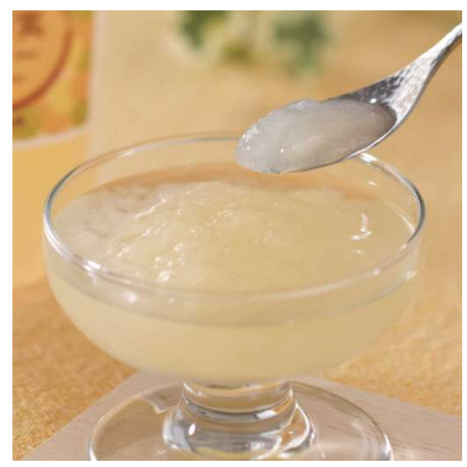
有限会社与佐工門 飲む ありの実ゼリー