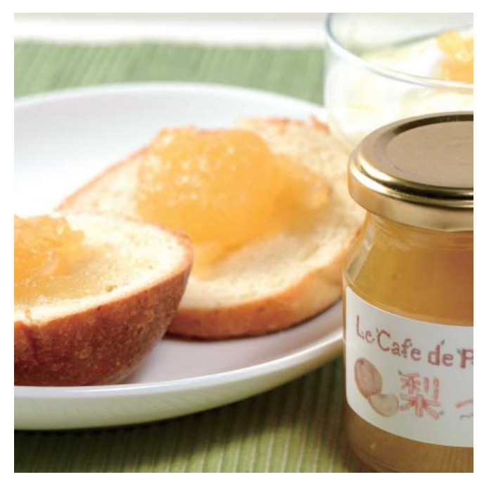
Le Café de Pomme コンフィチュール「梨っ娘」