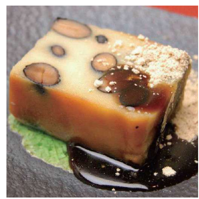
有限会社金田屋 黒豆の生カステラ