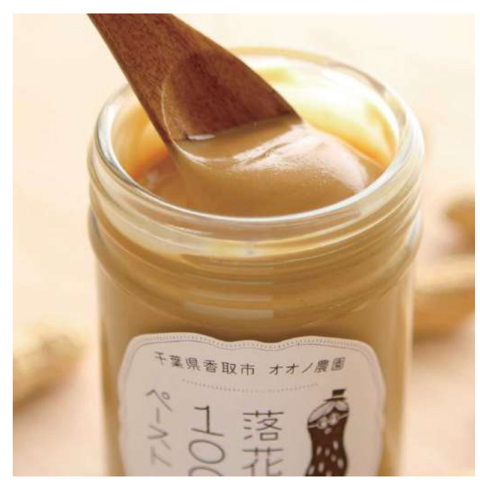
株式会社オオノ農園 落花生 100%ペースト