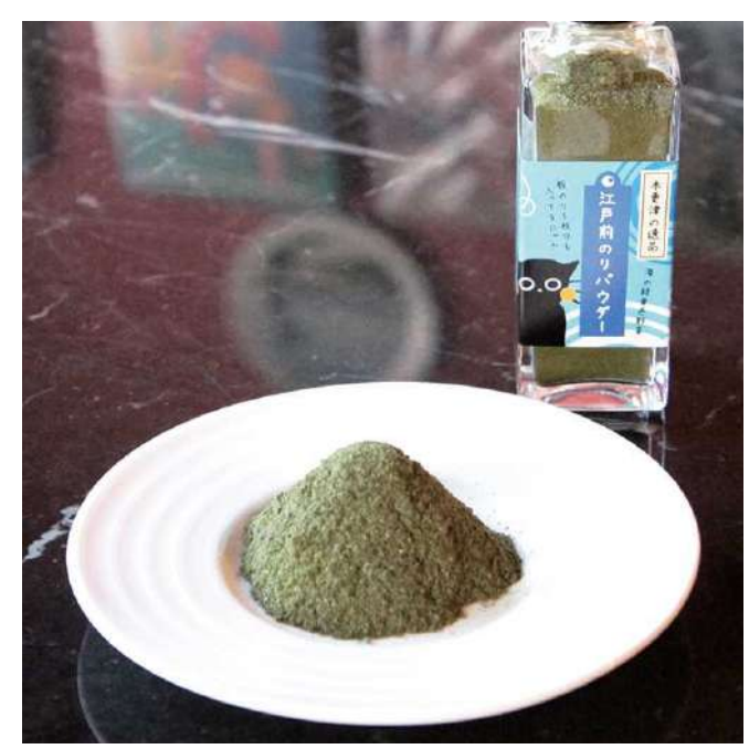
株式会社厨房 MITO 江戸前海苔パウダー