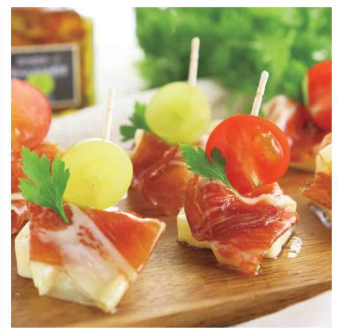
株式会社惣左衛門 柏幻霜ボーク生ハムオイル漬け