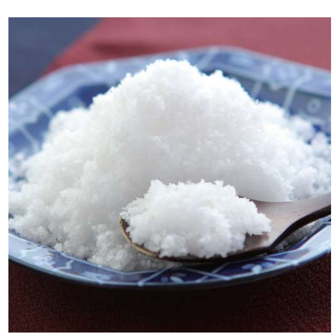
九十九里海の塩プロジェクト 山武の海の塩