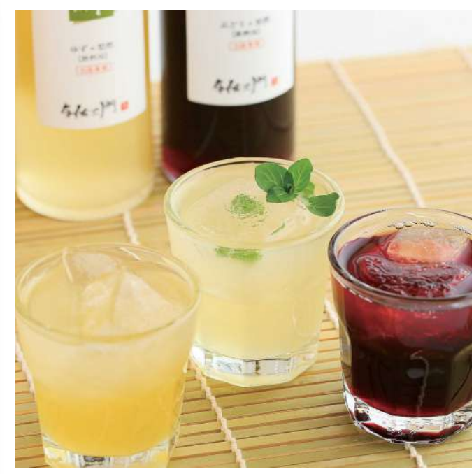
有限会社与佐工門 ありの実の酢・飲むありの実の酢