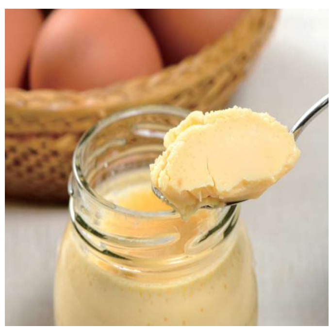
株式会社菜の花エッグ ちばのこだわりプリン（ピーナッツ味）