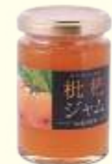
手工制作枇杷酱 648日元(含税)