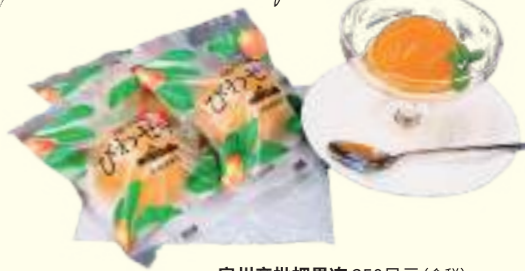
房州产枇杷果冻 350日元(含税)