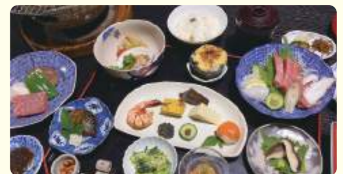
雅流怀石套餐 5,500日元(含税)