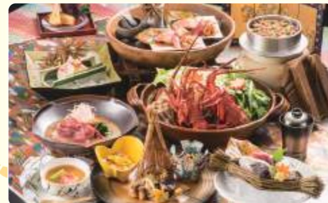
怀石料理 参之音 8,800日元(含税)