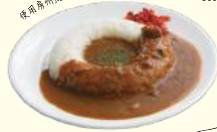
枇杷咖喱饭 900日元(含税)