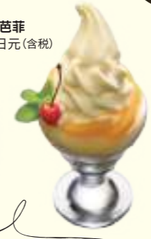
使用了枇杷果肉、 枇杷雪葩和枇杷软冰淇淋的奢华芭菲