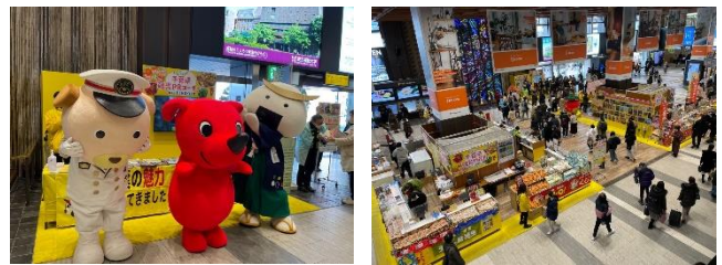
会場のイメージ（昨年度の様子）