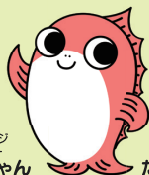
鴨川市イメージ キャラクター たいようちゃん