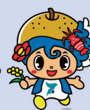
いすみ市イメージキャラクター いすみん