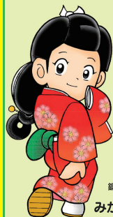
鋸南町イメージ キャラクター みかえりちゃん