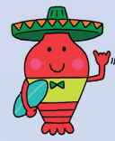
御宿町シンボルキャラクター エビアミーゴ

「ご当地キャラじゃんけん大会」を開催します。 各回参加者(先着40名様)にお土産をプレゼント! 各回上位3名様にはちよびり賛賞な お土産をプレゼント!