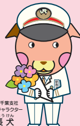
JR東日本千葉支社 マスコットキャラクター 駅長犬