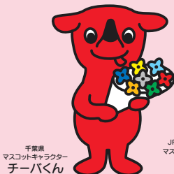
千葉県 マスコットキャラクター チャーバくん