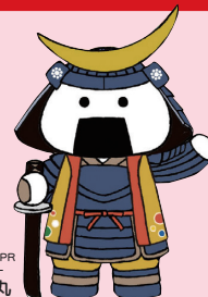
仙台・宮城観光PR キャラクター むずび丸