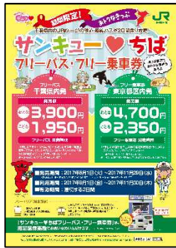
パンフレット表紙