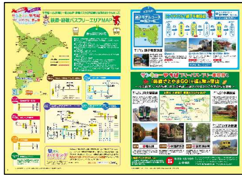
フリーエリアMAP・モデルコース特集ページ