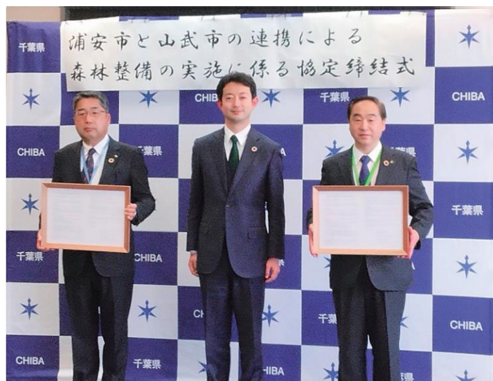
写真 4-4-5 浦安市と山武市の連携による森林整備の実施に係る協定締結式