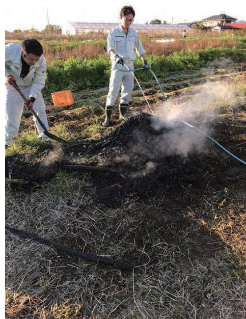
写真 4-4-4 バイオ炭の農地施用