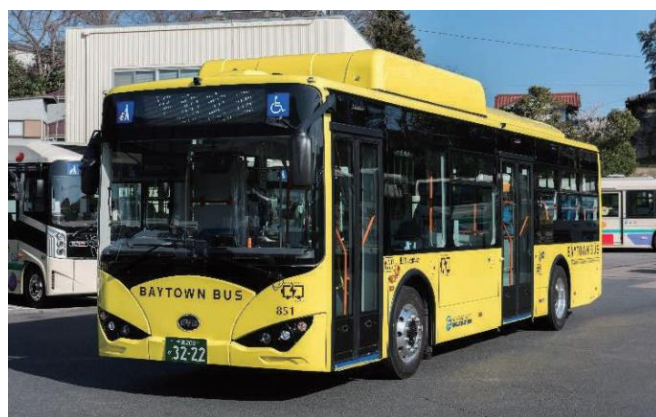
写真 4-5-4 EVバス