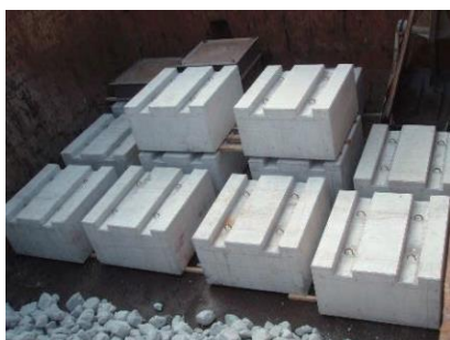
写真4-4-6 鉄鋼スラグ製品 （ブロック）