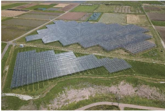
写真 4-4-1 匝瑳メガソーラーシェアリング第 1 発電所