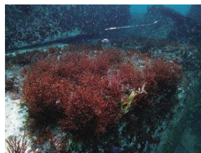
写真4-4-8 ブロックにテングサが 繁茂※