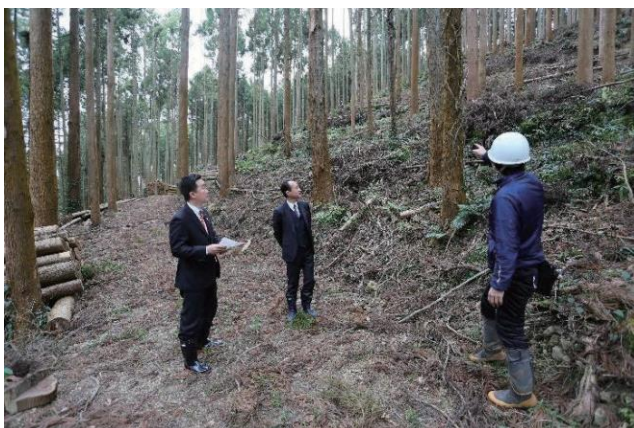
写真 4-4-9 習志野市と南房総市の森林整備広域連携協定に係る現地の森林視察

両市は、平成9年に「災害時における相互応援に関する協定」を結んでおり、今回協定を締結したことで、更に連携を深めながら事業を進めていくこととしています。