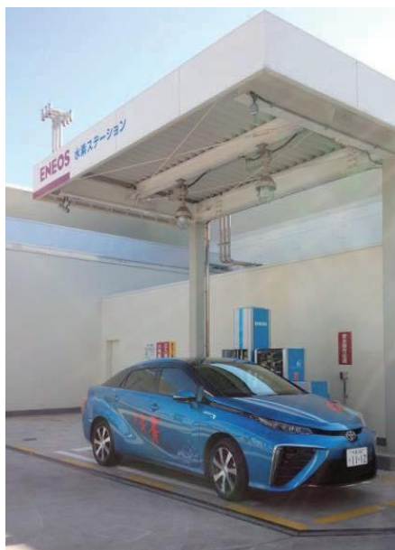
写真 4-5-2 水素ステーションと燃料電池自動車