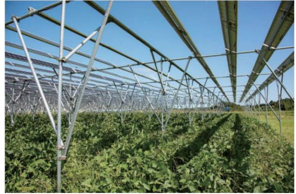
写真 4-4-2 第 1 発電所での営農(大豆栽培)