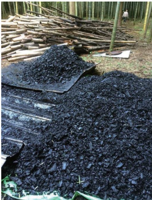
写真 4-4-3 バイオ炭