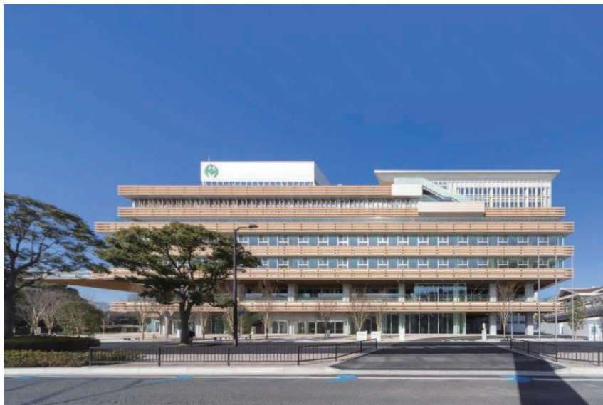
写真4-5-1 千葉市新庁舎