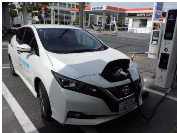
写真 4-5-3 充電設備と電気自動車