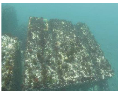
写真4-4-7 ブロック全体に テングサが着生※