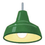
ペンダントライト