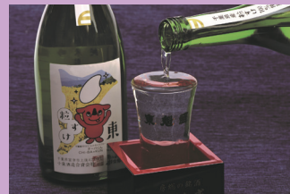
純米吟醸 東魁 粒すけ