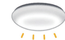
シーリングライト