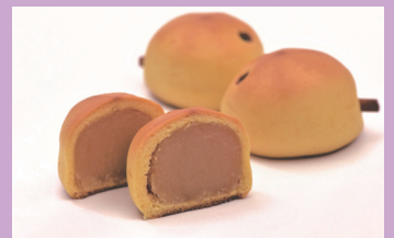
房州びわ 枇杷の実