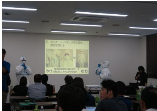
急性慢性家畜伝染病の防疫対応に係る 民間事業者向け研修会の開催