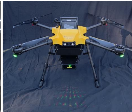
野鳥忌避レーザーを搭載したドローンの整備