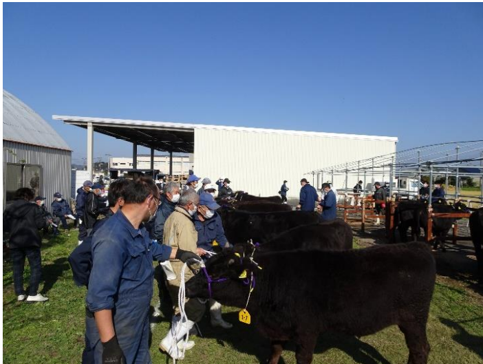
優良な繁殖雌牛を競う和牛共進会