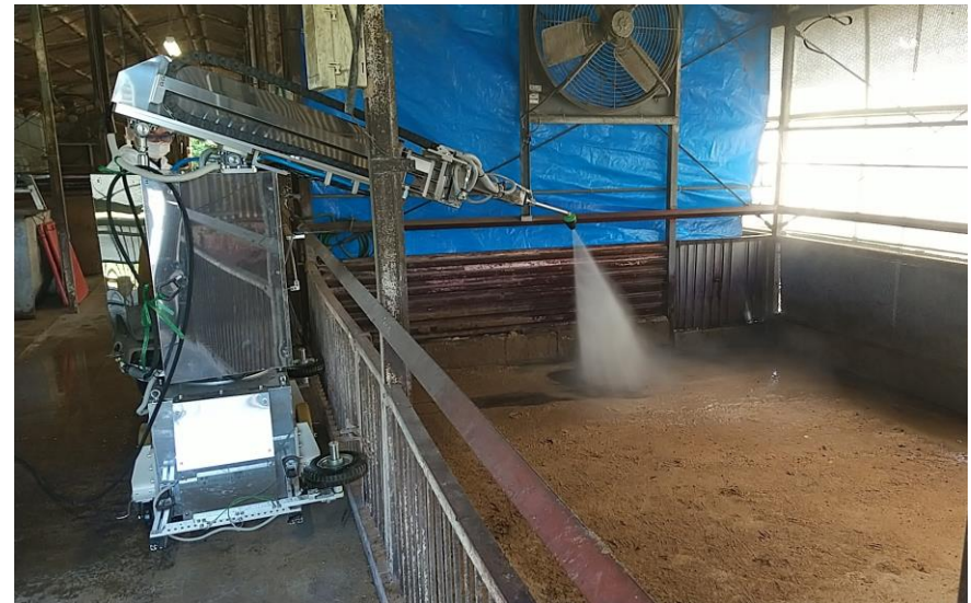
畜産総合研究センターで開発協力した畜舎洗浄ロボット(試作機)