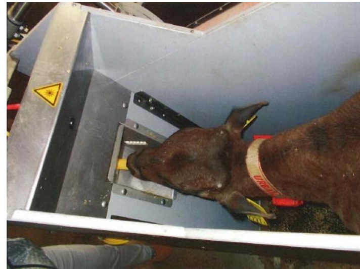
スマート技術を導入した飼養管理