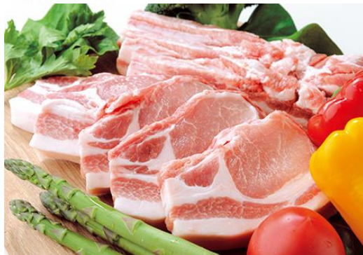
県産豚肉(チバザポーク)