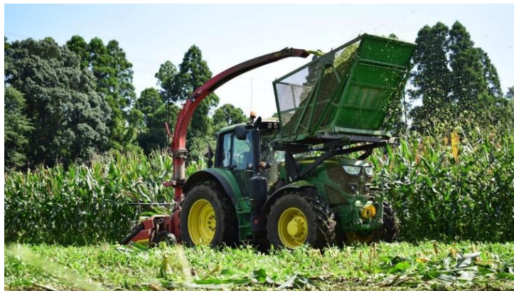
家畜の飼料となる青刈りとうもろこしの収穫