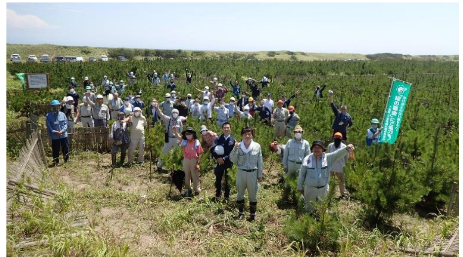
企業等による森林整備活動