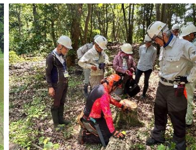
里山活動団体による森林整備