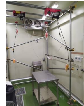
ジビエの処理加工施設（外観・内部）