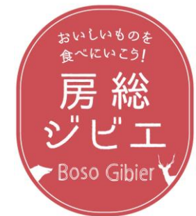
「房総ジビエ」ロゴマーク