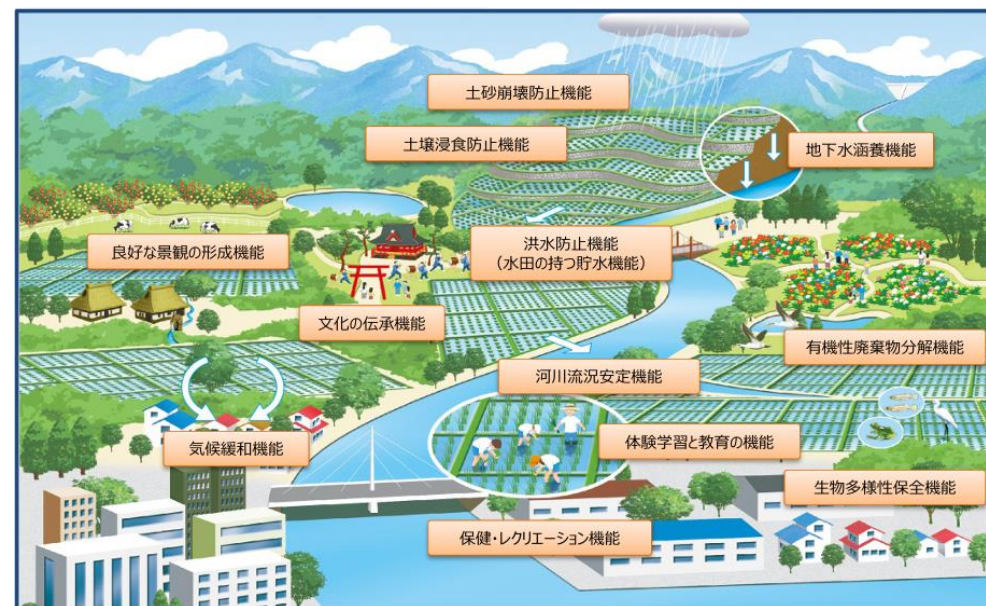
農業の有する多面的機能（「令和7年度多面的機能支払交付金のあらまし」から引用）