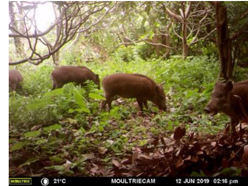
センサーカメラで撮影したイノシシ