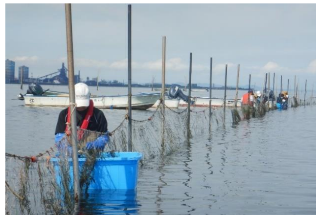
干潟の保全活動（囲い網設置）