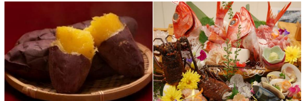
県産農林水産物の魅力を発信

今後は、生産・流通・販売の各段階における輸出支援を行うとともに、成田市場及び成田空港を活用した県産農林水産物の輸出拡大を図る必要があります。