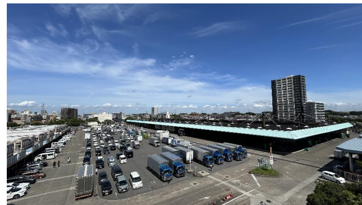
船橋市地方卸売市場(外観)