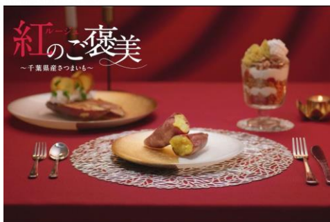
紅(ルージュ)のご褒美～さつまいも～