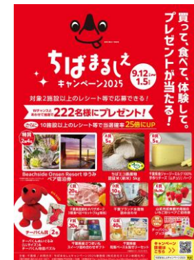
ちばまるしえすキャンペーン