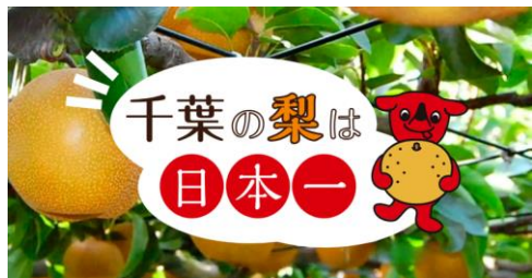
千葉の梨は生産量は日本一