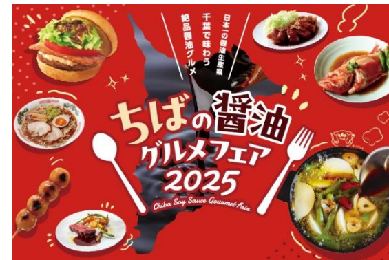
ちばの醤油グルメフェア

また、「成田市公設地方卸売市場経営戦略」における令和12年度(2030年度)までの農水産物の取扱高計画を踏まえて、成田市や市場関係者等と連携しながら、成田市場で輸出に取り組む事業者の商流構築や成田空港周辺における輸出産地形成など、成田市場及び成田空港を活用した県産農林水産物の輸出拡大に取り組みます。