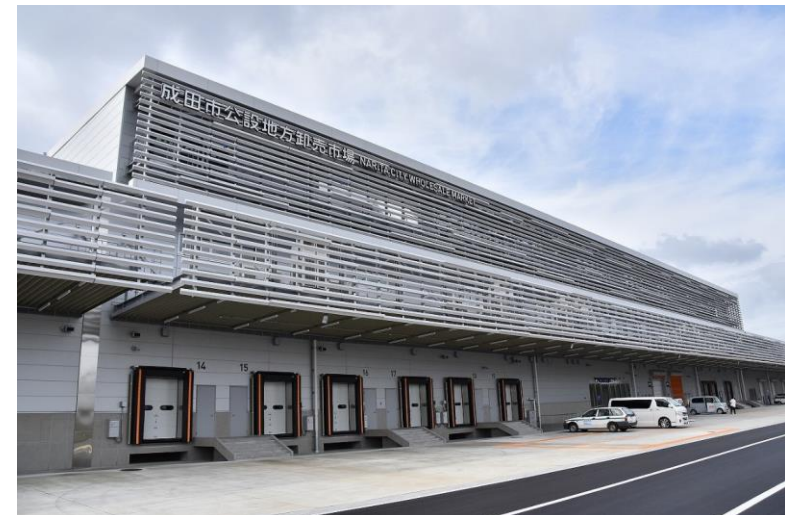
成田市公設地方卸売市場（外観）