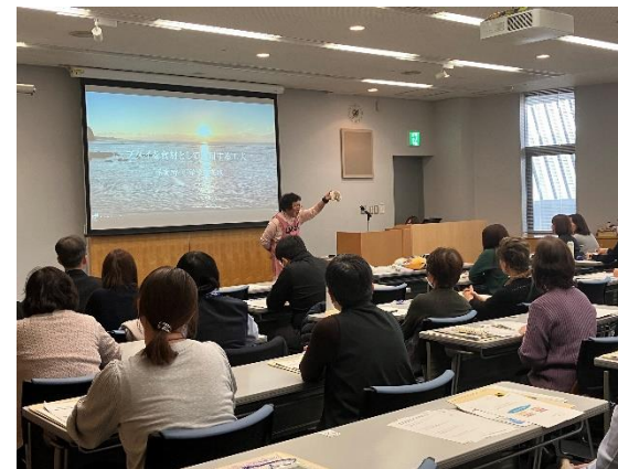
食育ボランティアを講師とした研修会の様子