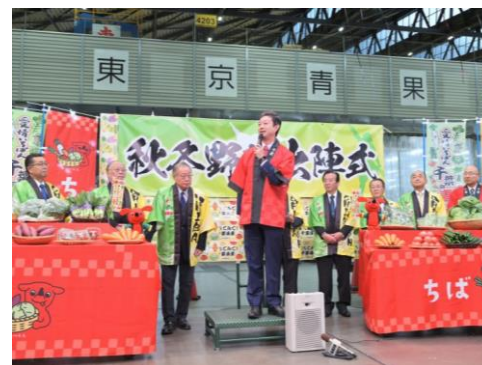
産地と連携した卸売市場内でのセールスプロモーション