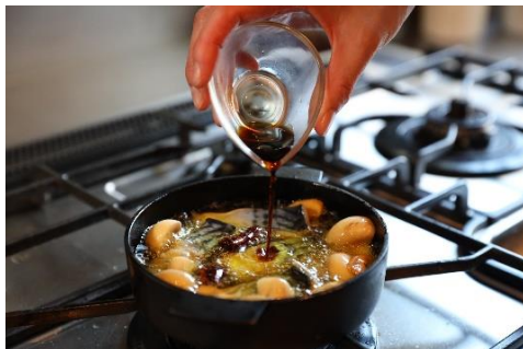
さばとマッシュルームの黒アヒージョ