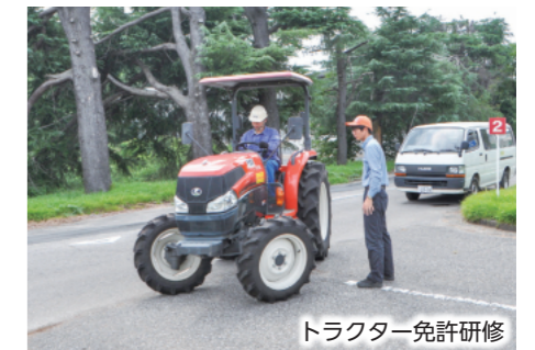
トラクター免許研修