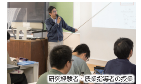
研究経験者・農業指導者の授業