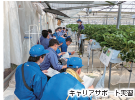
キャリアサポート実習