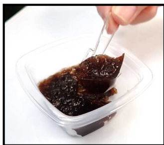
図 2 開発した「海苔三杯酢の寒天寄せ」