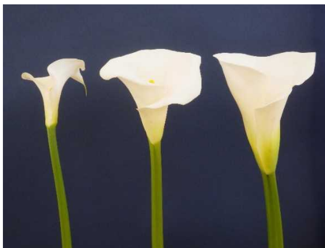
写真1 左から「千葉C2号」、「アクアホワイト」、「ウェディングマーチ」の花（苞）