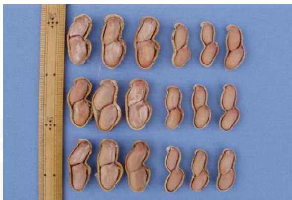
図1 ゆで豆の莢と子実